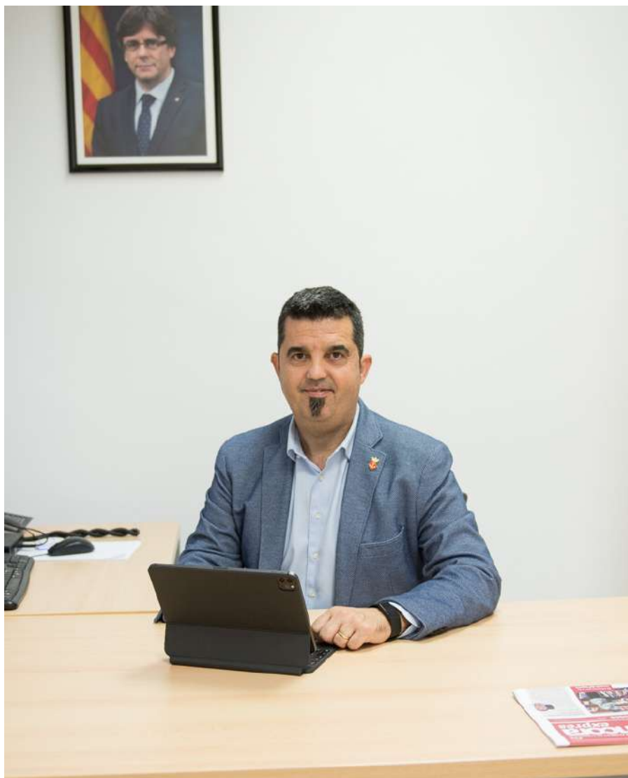
Isidre Sierra - Alcalde de Sant Climent de Llobregat

I evidentment mantindrem els altres dos grans eixos que ens han caracteritzat com a administració: continuar treballant per sumar més i millors serveis, com per exemple l'atenció socio sanitària a la nostra gent gran o l'ampliació del consultori mèdic i la millora continuada de la nostra via pública.