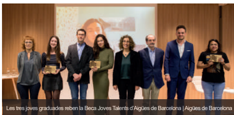
Les tres joves graduades reben la Beca Joves Talents d'Aigües de Barcelona | Aigües de Barcelona

Aigües de Barcelona i la Confederació d'Associacions Veïnals de Catalunya (CONFAVC) van celebrar el passat 14 de novembre la graduació de la tercera promoció d'estudiants del programa Beques Joves Talents , en un acte a l'edifici Ciutat de l'Aigua que també va servir per donar la benvinguda als cinc nous joves becats del curs 2023/24 .