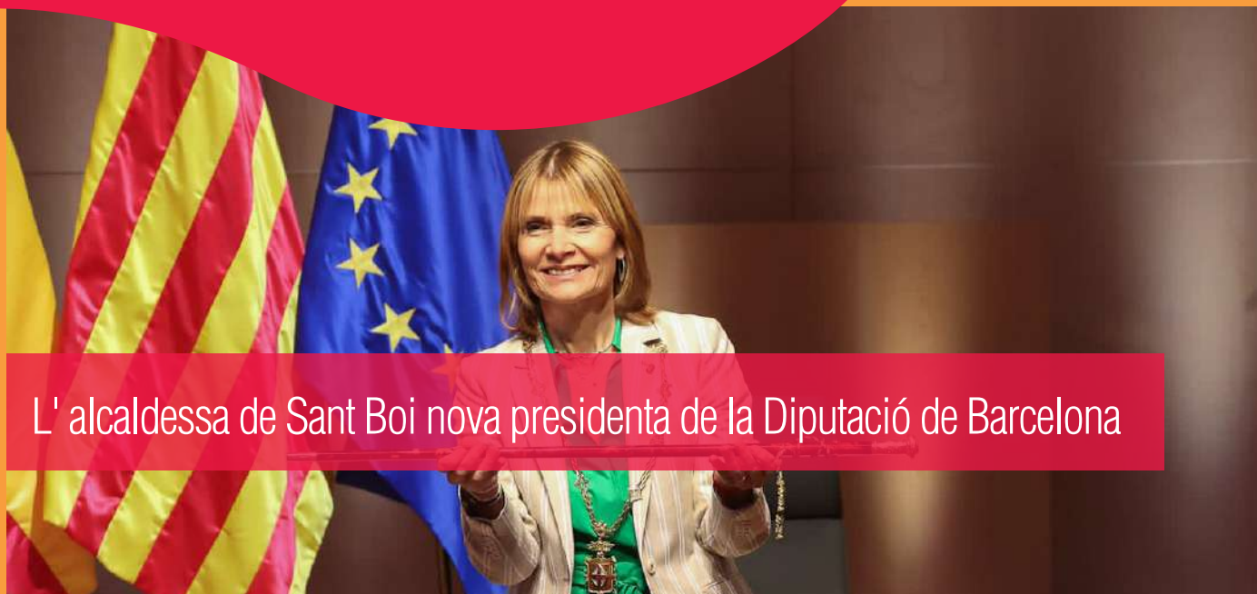
Foto: Imatge de la presidenta de la Diputació de Barcelona

L'alcaldessa de Sant Boi nova presidenta de la Diputació de Barcelona